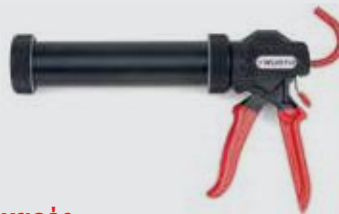
Πιστόλι χειρός σακούλας 300 ml

Κατάλληλο για χρήση με μεταλλικές και πλαστικές φύσιγγες.