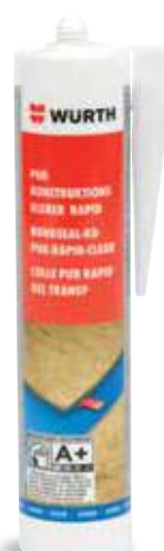
ΚΟΛΛΑ ΚΑΤΑΣΚΕΥΩΝ PUR RAPID