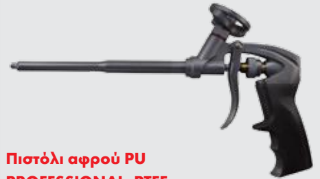
Πιστόλι αφρού PU PROFESSIONAL -PTFE

Για την επαγγελματική εφαρμογή του αφρού PU.