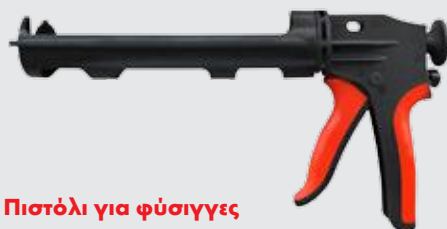
Πιστόλι για φύσιγγες 310 ml με χειρολαβή από PVC