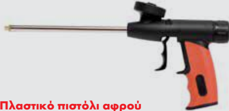
Πλαστικό πιστόλι αφρού PU ECO, κόκκινο/μαύρο