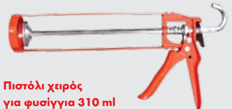
Πιστόλι χειρός για φύσιγγα 310 ml