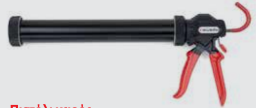
Πιστόλι χειρός σακούλας 600 ml