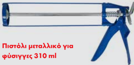
Πιστόλι μεταλλικό για φύσιγγες 310 ml